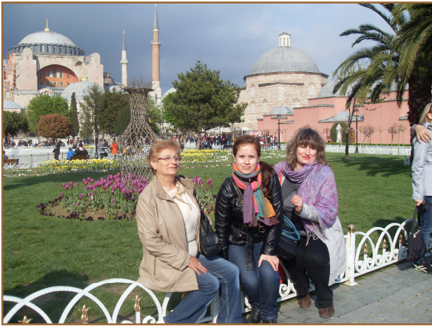
Пред Света София In front of The Hagia Sophia

Света София най-напред е построена като християнска дървена църква по заповед на император Константин. Няколко пъти е унищожавана и построявана отново. В сегашния си вид е построена през 537г. и открита за богослужение на Рождество Христово. След превземането на града, османският султан Мехмет II Фатих през юни 1453г. извършил в „Св.София” първата петъчна молитва. Църквата е превърната в джамия. През 1935г по инициатива на М.К.Ататюрк „Св.София” е обявена за музей, храм за всички религии, културен паметник на света.