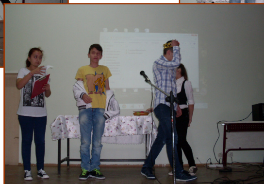
Romanian children performed on a scene, showing their English and art skills.