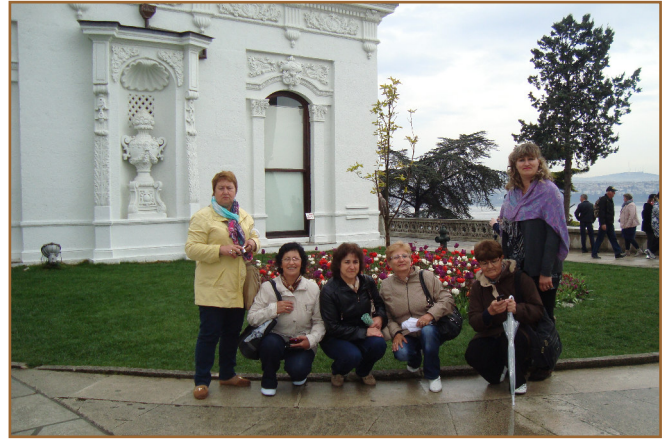
Султансият дворец „Топкапъ” The Sultan's Topkapi Palace

Editor: Dochka Dobreva Reporters: Stoyanka Staeva, Stoyanka Josifova, Magdalena Doncheva.