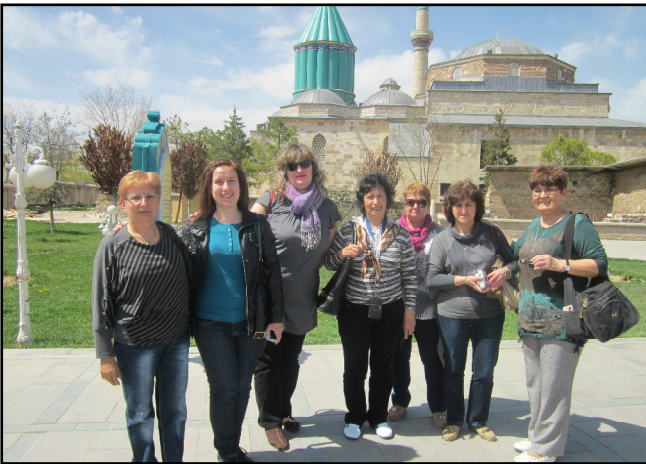
In front of the museum of Mevlana Пред Музея на Мевлана

"What can I say about Mevlâna? If you listen to Rumi, you will become better Christians. If you follow the Rumi, you will be even better Jews. If you open the hearing for Rumi, you will become better Muslims, because Rumi is universal. "