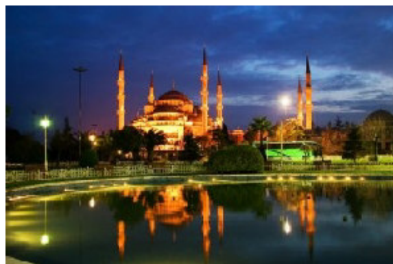
Синята джамия „Султан Ахмет“ Blue Mosque, Sultan Ahmet

The architect, knowing that it requires a lot of cost, resorted to a trick. He built six minarets, as explained to the Sultan, that he misunderstood his will (alt"-six, alton-gold). The other landmark of the mosque is the abundance of blue and green pottery, which is known by the name the Blue Mosque.