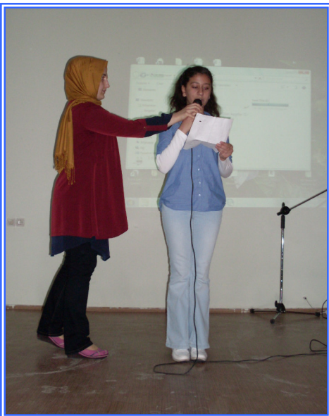
Турските деца поздравяват присъстващите с песни. На екрана се проектираха снимки, припомнящи предишните ни срещи. Turkish children greet participants with songs. On the screen were projected pictures from our previous meetings.