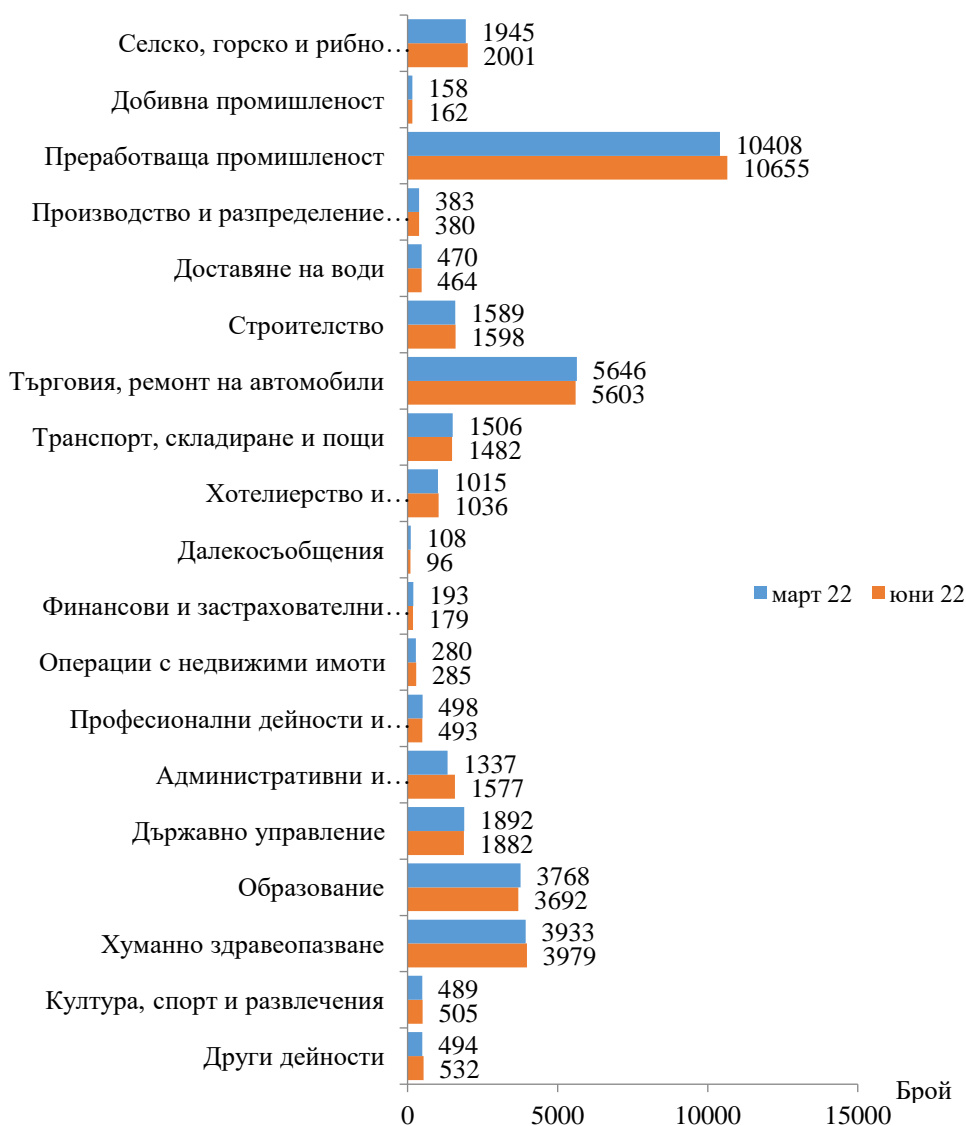
Фиг. 1. Наети лица по трудово и служебно правоотношение в област Сливен към края на март и юни 2022 година

Спрямо края на първото тримесечие на 2022 г. наетите лица в общественния сектор се увеличават с 2.2% (достигат до 11.2 хил.), а в частния сектор - с 1.0% (достигат до 25.4 хил.).